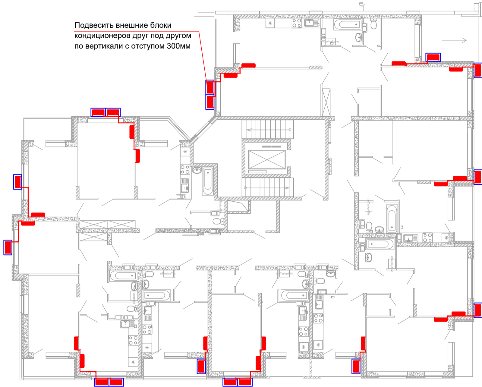
Схема размещения кондиционеров.